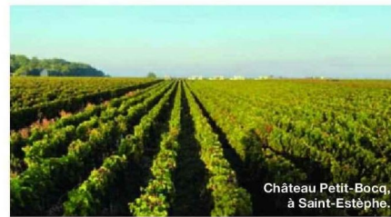
Château Petit-Bocq, à Saint-Estèphe.