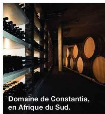
Domaine de Constantia, en Afrique du Sud.